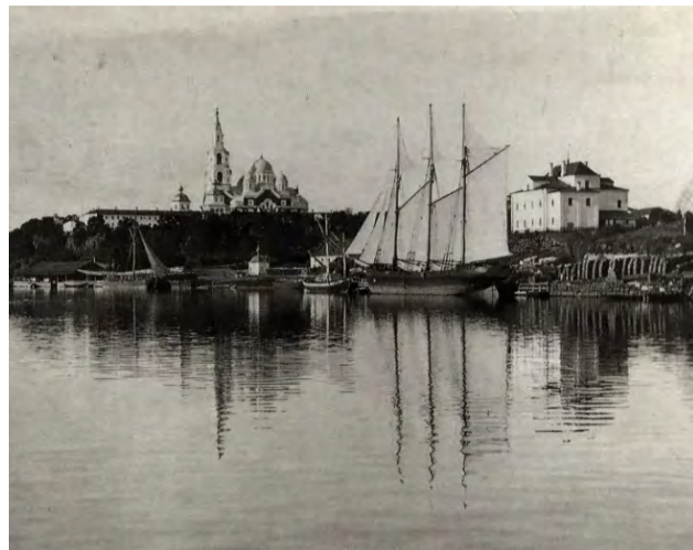
Вид на причал и баркас, построенный для императорской семьи в 1865 году, 20-е годы 20 века.