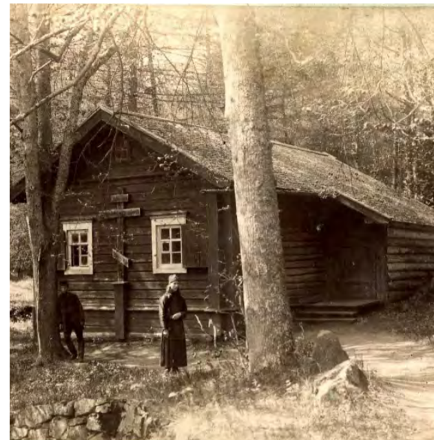
Изда игумена Дамаскина на Валааме, 10-е годы 20 века

Обилие поминальных книг сократили четырехугольными дощечками размером 30 x 30 см с приклеенными к ним листами бумаги с написанными на них именами