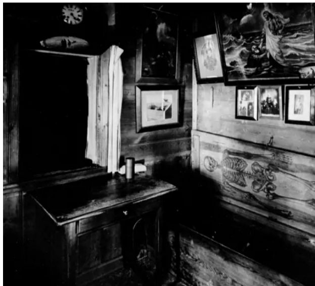
Внутренне убранство келии пустынножителя.