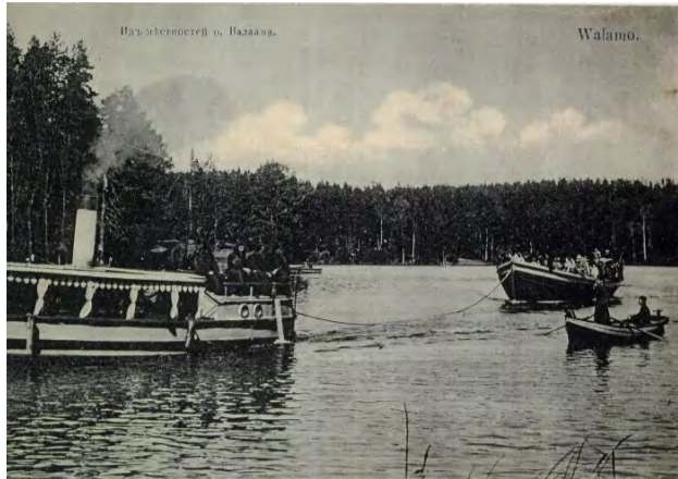
Пароход с паромом.

Утром в 3 часа отправлялись в лес за лошадьми; уходило много времени, чтобы собрать их в конюшни, раздать овес, сено и напоить. К 6-ти часам они должны быть запряжены. Не у всех висели на шее колокольчики, таких было трудно разыскать на большой территории, особенно в дождливую погоду; в монастыре зонтики и плащи не водились. Укрощение и прируче-